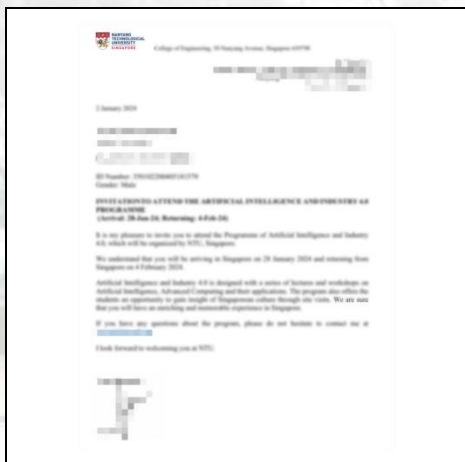
项目录取邀请函 (样例)