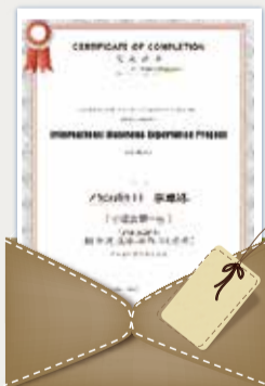
五百强企业项目完成证书