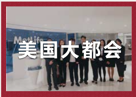
美国大都会集团 财富五百强第114位--标准普尔：A+

凭借接近140年的经验，美国大都会集团公司是美国最大的人寿保险公司，现为美洲、亚太区及欧洲的9000万客户提供创新的服务和解决方案，致力于帮助客户建立财务自主。2005年，伴随着集团获得了Travelers Life & Annuity和几乎全部花旗集团的国际保险业务,美国大都会集团在成为了北美最大的人寿保险公司的同时,也扩大了在国际市场上的份额。