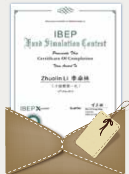
投资策划大赛证书