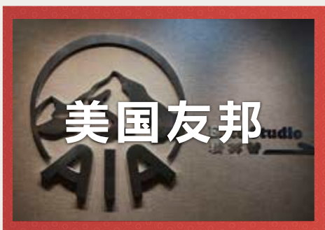
美国友邦保险集团

万通作为欧美前五大金融集团，这么top的万通公司小丸子建议以后想要去美国留学这个学校可是绝佳选择之一！除此之外公司身处九龙太子西的世纪大楼内，奢侈品化妆品围绕周围！下班后让你神气的走进大楼，好神气哟！