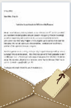
五百强企业高层个人推荐信