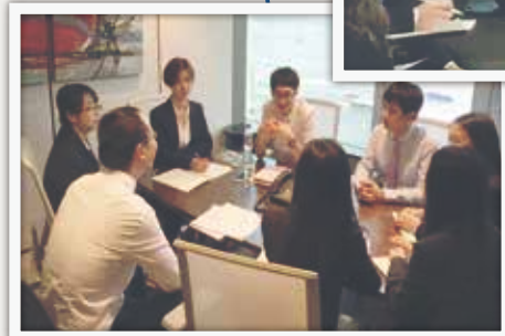
多元化的国际导师团队