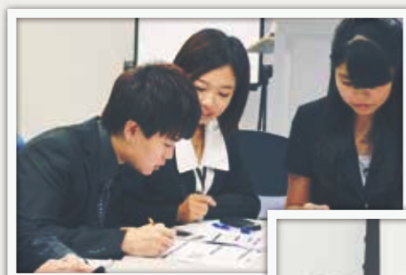
来自公司多个部门 不同领域的精英员工亲临指导