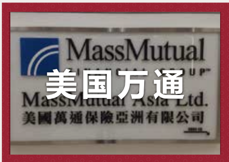
美国万通金融集团 标准普尔：中国 AAA-- 标准普尔：中国 AAA--

富卫的前身是ING荷兰国际金融集团，后来被李嘉诚收购了亚太地区的业务重组成新的企业FWD。小编也是非常推荐大家能参加这个公司的实习，公司的工作氛围非常浓厚，会议厅还有免费的咖啡机。导师们也非常的nice。项目中，公司对所有实习生都是以最严格的企业员工标准来要求，所有小伙伴们在项目中也能体会到真正的高级精英的职场素养！