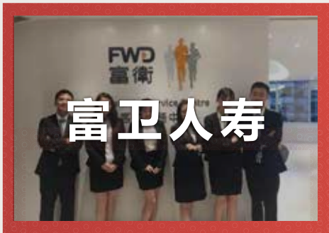
富卫人寿金融集团 原世界五百强排名第64位/荷兰国际金融集团香港分部

大都会公司目前已经成立了1868年，有200多年的历史。在2012年大都会人寿已经在财富500强企业排名为114位！所有参加项目选择大都会公司的同学也是相当多的。而毕业后想去到美国进行读研和工作的同学，就适合申请这个企业的实习啦。要努力在7天中获得企业的认可，拿到实习OFFER和推荐信，也是一个非常不错的挑战！