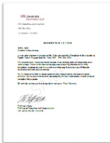
学员推荐证明信（示例）