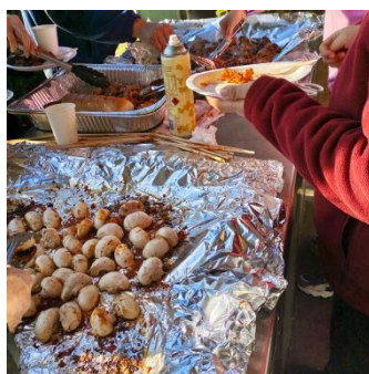
往期学生烧烤活动