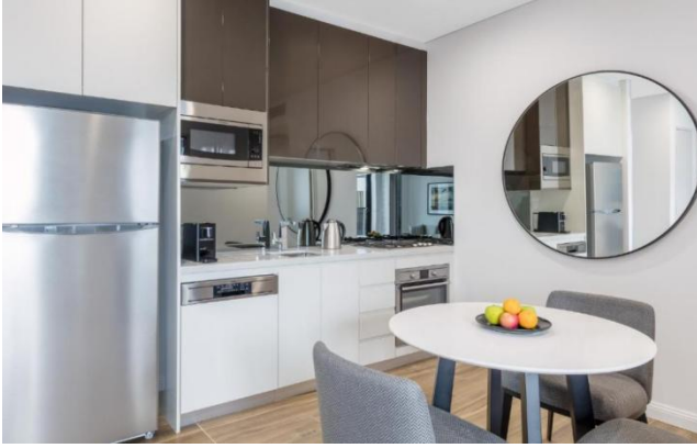
开放厨房，厨具完备，可做饭