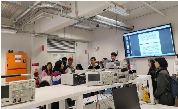
往期学生工程学院实验室参访

3. 视情况安排相关学院师生交流活动，如：可与悉尼大学工程学院教授面对面交流，参观相关工程实验室；可与悉尼大学商学院讲师面对面交流，和悉尼大学商学院往届生交流，分享海外学习和生活，为未来有志于留学的学术提供思路和帮助；