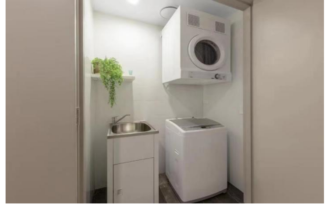
洗衣烘干设施完备