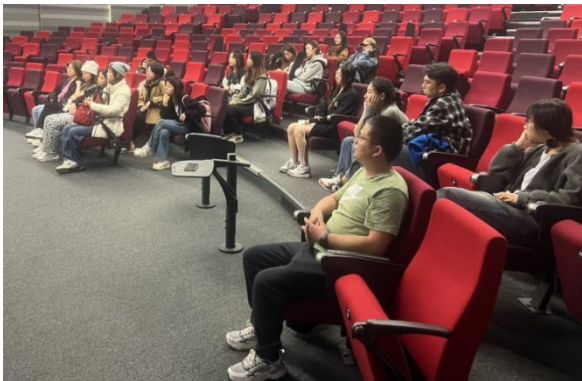
往期学生商学院交流活动

4. 视情况安排当地知名企业参访活动，认识行业发展趋势，深入了解当地企业的发展历程和现代化发展成果；