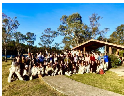
往期学生蓝山合影

6. 项目组成员完成课程后可获得悉尼大学语言中心颁发的项目结业证书，世界名校的短期课程结业证书可作为申请海外名校留学的重要背景材料；