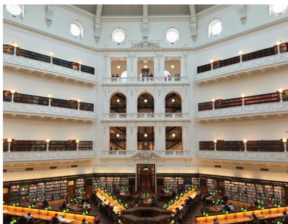
维多利亚州立图书馆