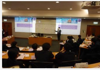
香港银行业与金融市场