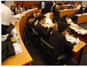
市场营销与品牌管理