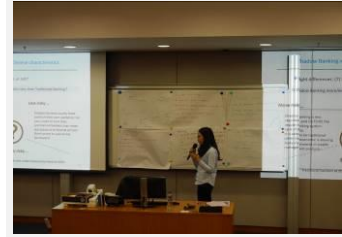
投资理财与证券交易