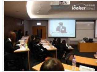
七国集团及金砖四国