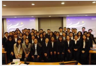
影响力与谈判技巧