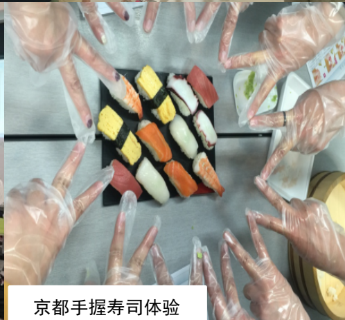
京都手握寿司体验