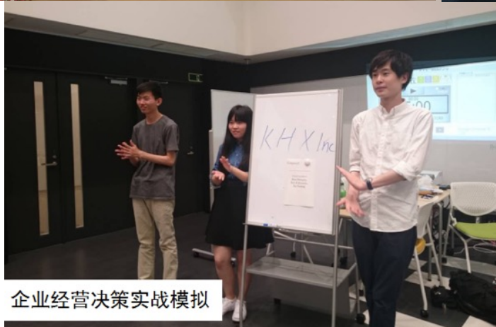
企业经营决策实战模拟