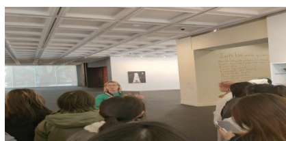
参览原住民文化馆