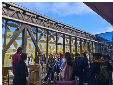
与西澳大学 PHD 交流

3. 课程以外安排相关学术交流活动，如：Workshops 和在校 PHD 一起开展交流活动、参访实验室；