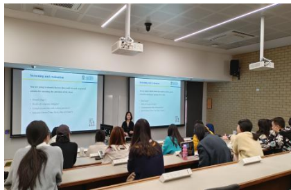
参加西澳大学 PHD 讲座