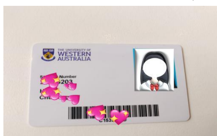
西澳大学访学学生卡

1. 注册成为西澳大学访学学生，获得学生证，使用图书馆等校内公共资源，乘坐公共交通可享受当地学生折扣待遇；