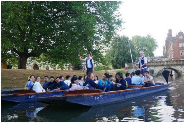
参访剑桥大学——体验康河泛舟