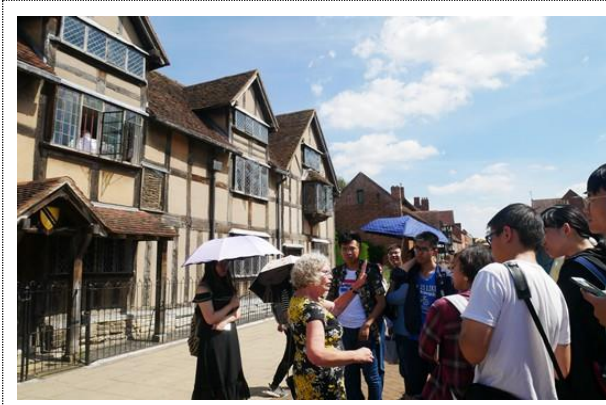
参访莎士比亚故居