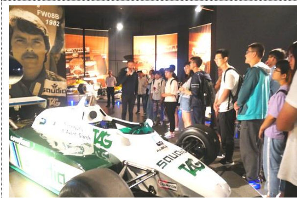
参观威廉姆斯 F-1 赛车工场