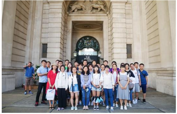
参访伦敦金融城——皇家证券交易所