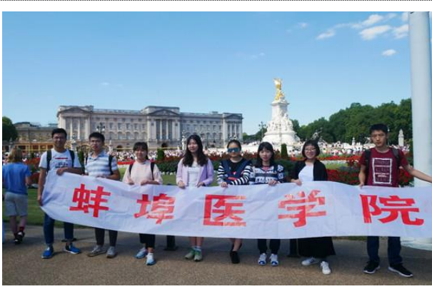
伦敦精华地表游览——白金汉宫