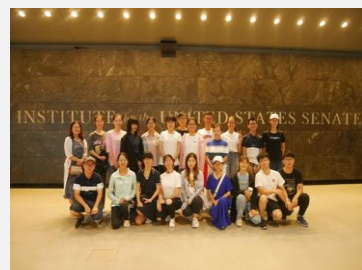
肯尼迪政法研究中心

在课余时间，我们将带领学员充分探索波士顿的魅力：波士顿海湾、自由之路、保诚大厦……对美国自由文化沉浸式体验的同时，提升跨文化沟通技能。