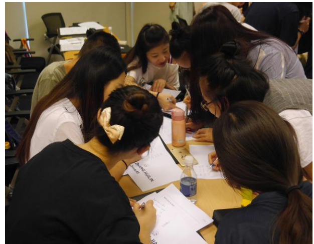
企业实训小组活动 2