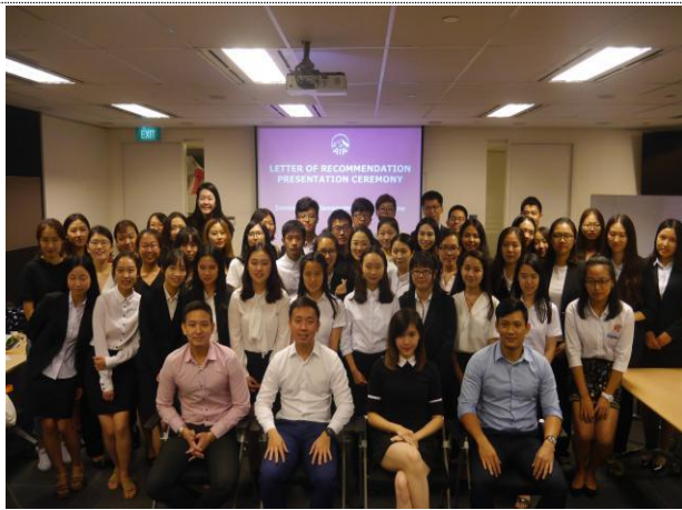
企业实训结业大合影