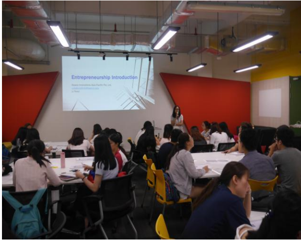
创投公司创业讲座