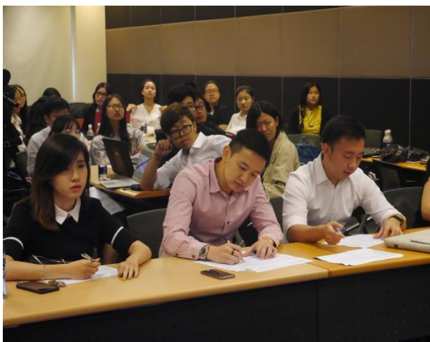
企业结业评委点评