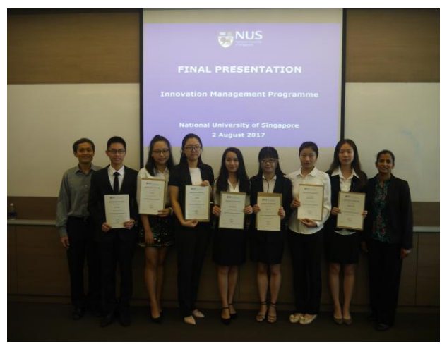
国大颁发结业证书