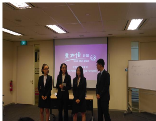
企业结业比赛展示