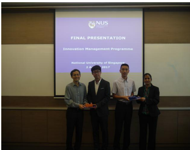
国大赠送老师礼物