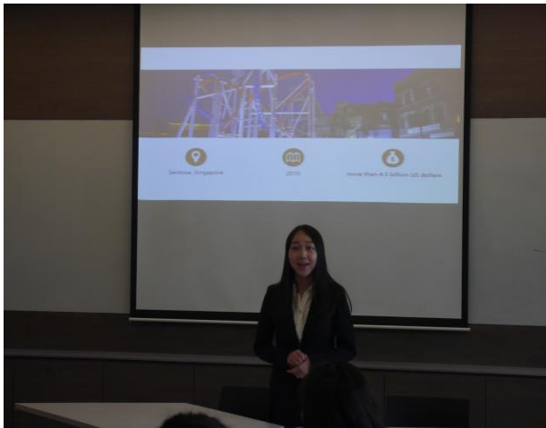
国大结业比赛展示