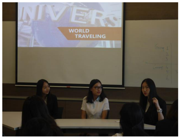
国大结业比赛展示