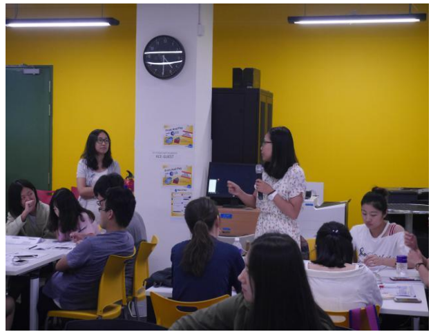
学生提问创业问题