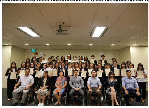
企业实训结业大合影